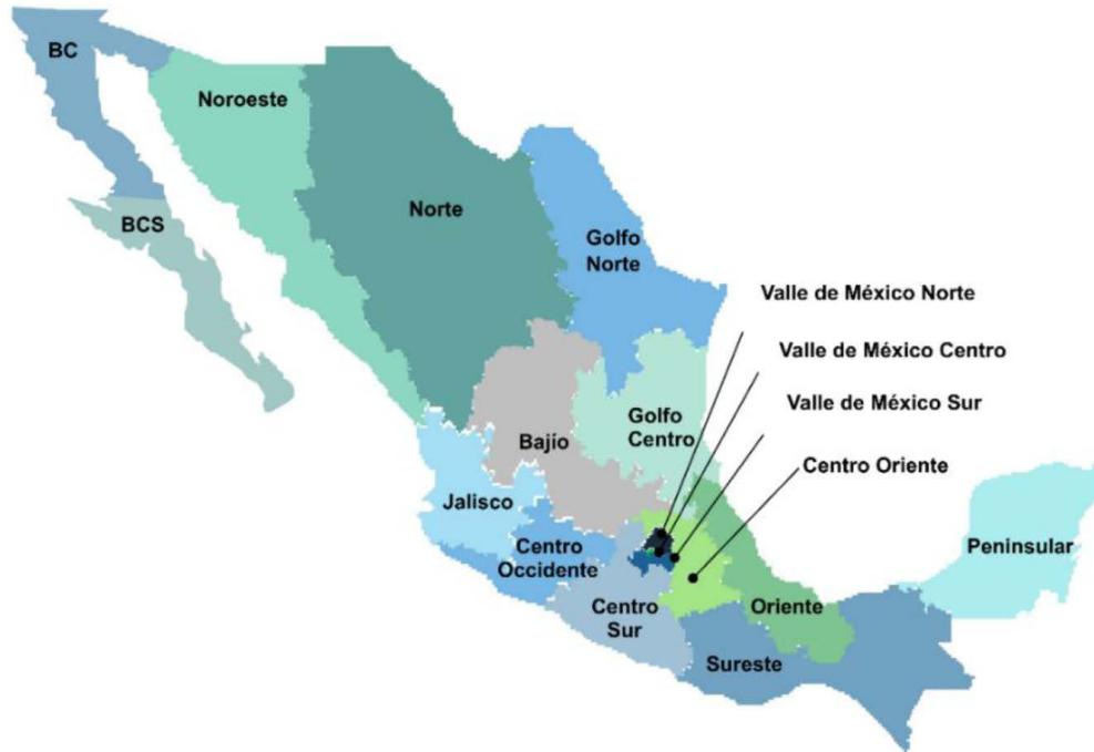
Figura 1. Divisiones tarifarias

Las TFSB se clasifican en 17 divisiones tarifarias como se muestran en la Figura 1: