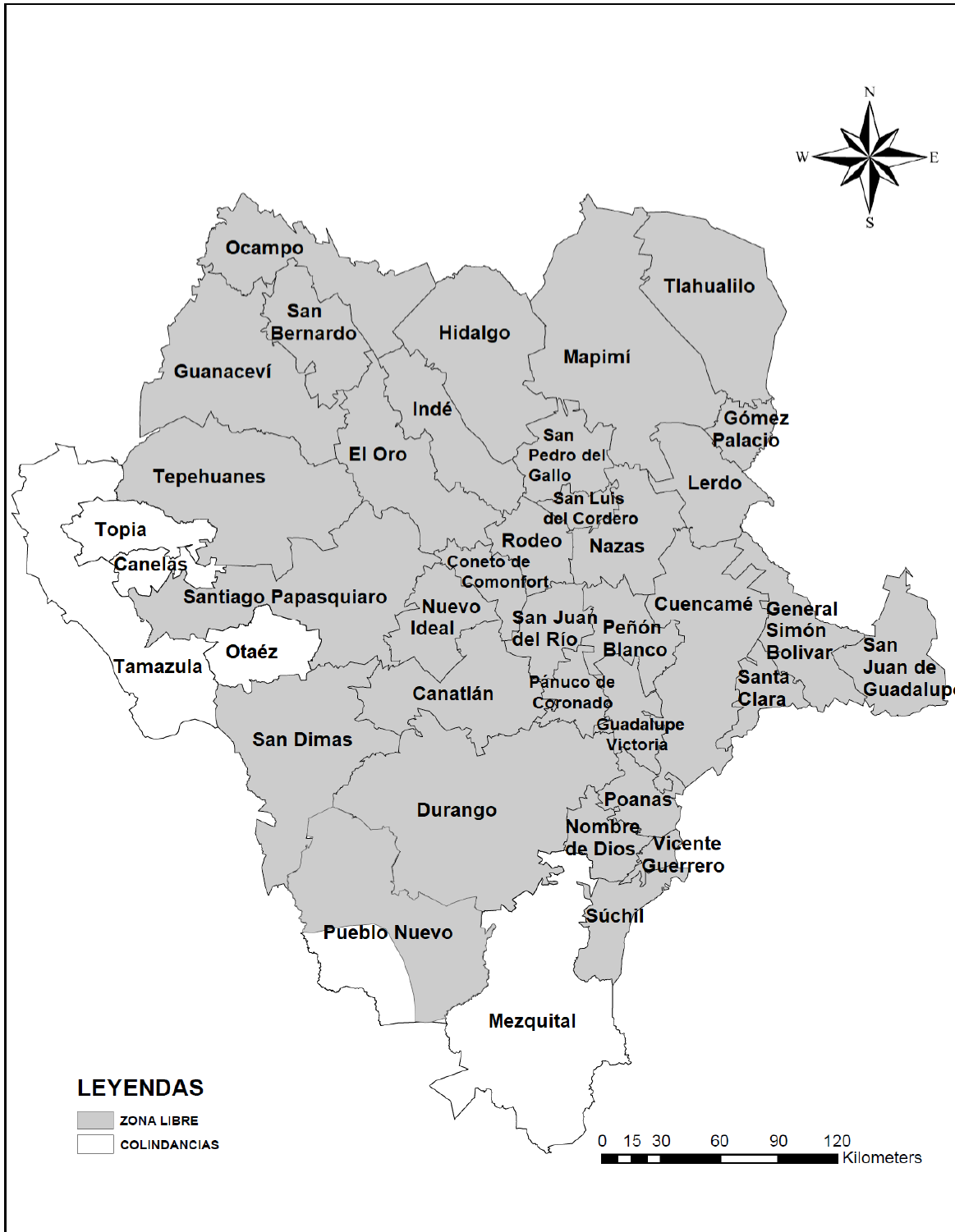
Mapa. Municipios y Región Norte y Sureste del municipio de Pueblo Nuevo del Estado de Durango.