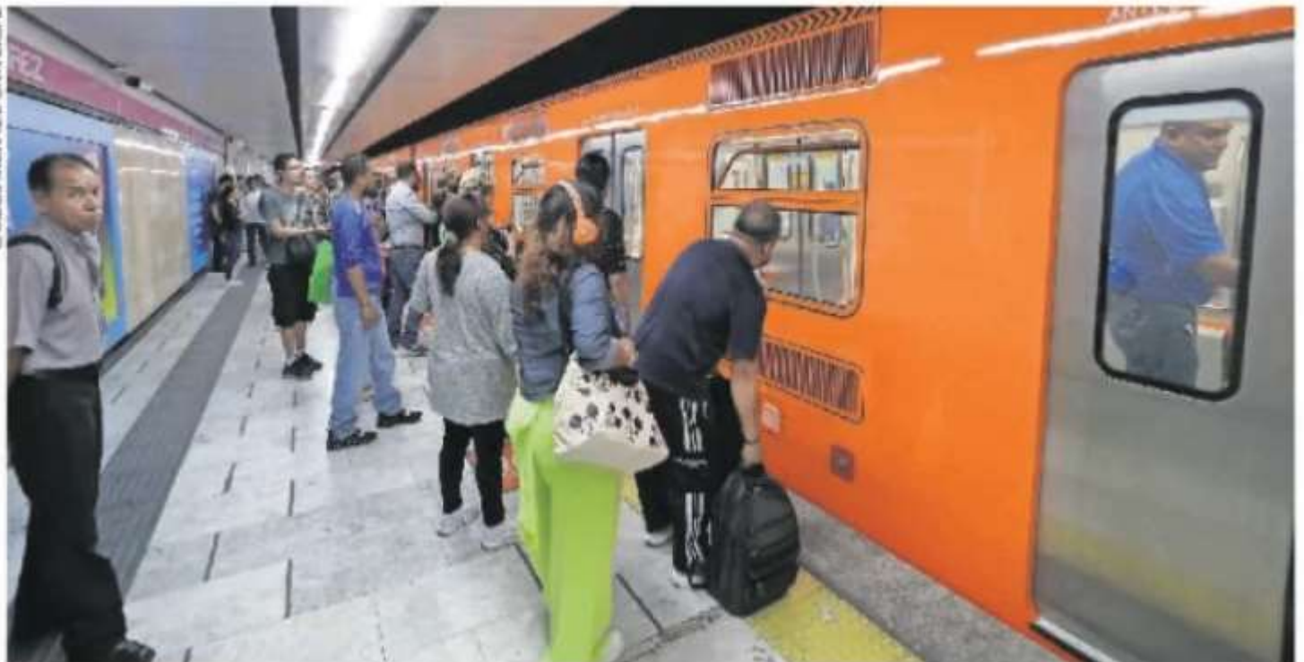
Usuarios de la Línea 1 señalaron que son insuficientes los trenes en el tramo Pantitlán-Isabel La Católica.