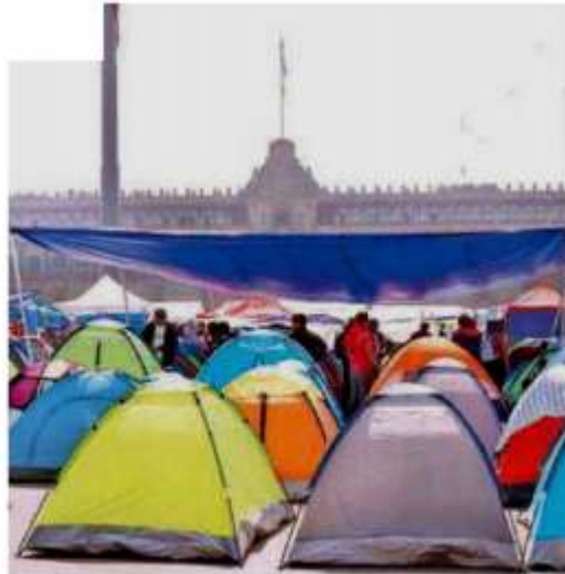
El plantón nacional unitario de la CNTE fue instalado el pasado 15 de mayo

A decir de la CNTE, unos y otros han sido parte de esta política que se mueve a conveniencia, sin principios ideológicos, ni ética política “nosotros no somos comparas de ningún presidente o partido político ni de la derecha fascista ni la continuidad neoliberal”.