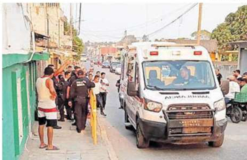
Otro hecho sangriento sacude a Tabasco.