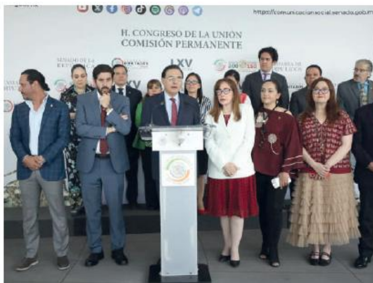
Diputados y senadores de Morena en conferencia de prensa.

En conferencia de prensa, diputados y senadores de Morena y sus aliados miembros de la Comisión Permanente argumentaron que la también presidenta de la Suprema Corte de Justicia de la Nación (SCJN) violó la autonomía del Poder Judicial y el Código de ética judicial al