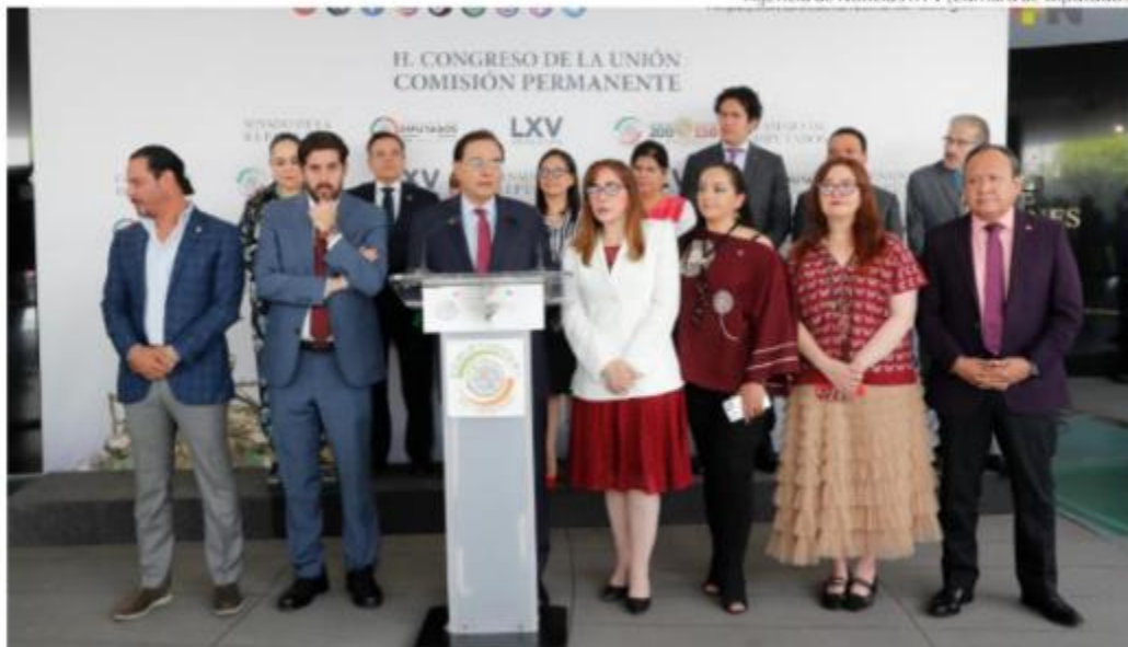
Los diputados acusan a la ministra Norma Piña.

Agencia de Noticias RTV (Cámara de Diputados)