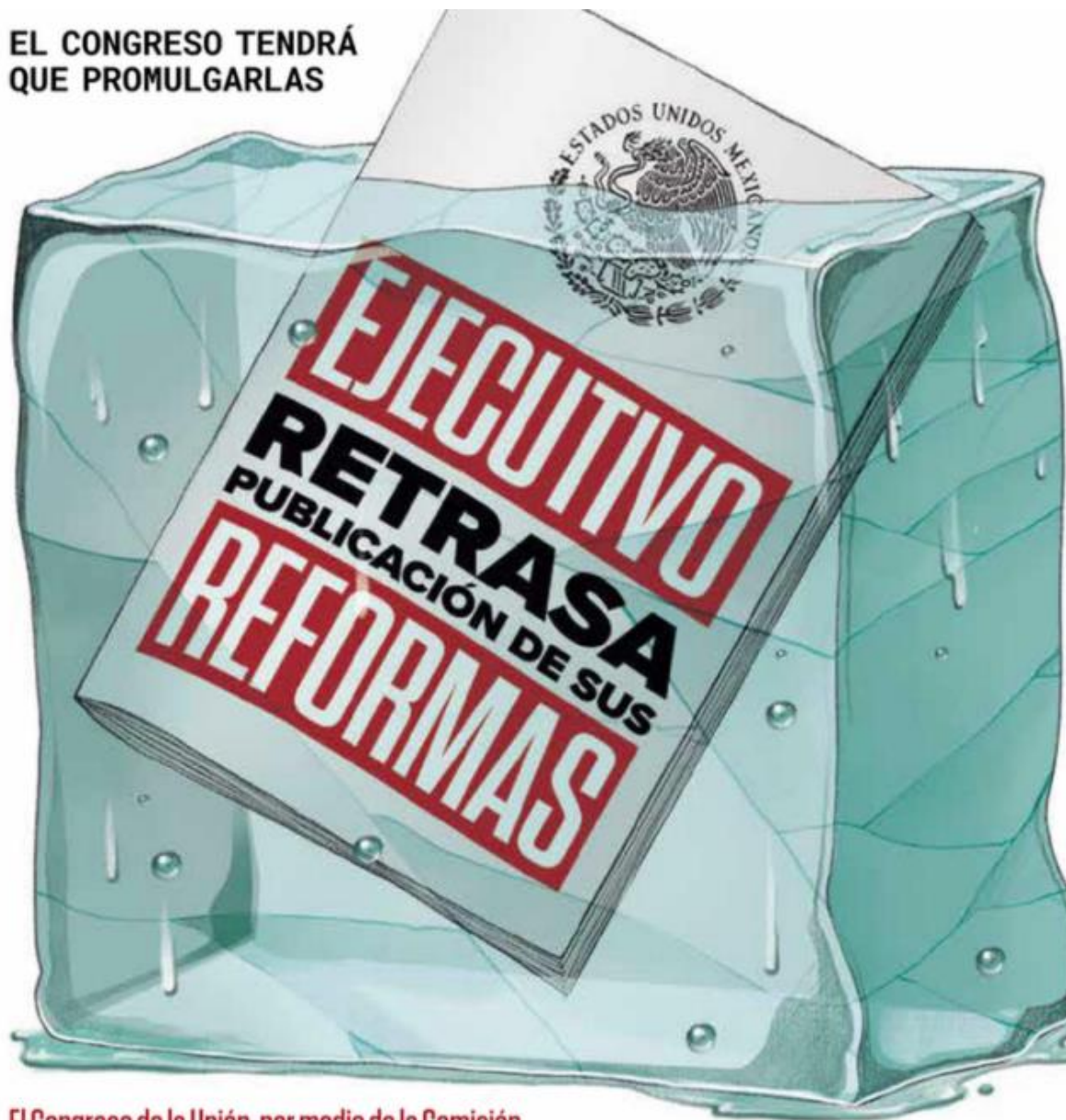
Ilustración: Horacio Sierra

Pero además, ayer jueves 23 de mayo venció el plazo de veto presidencial para la reforma en materia de documentos de acreditación de nacionalidad mexicana, pues el Ejecutivo federal la tiene desde el 23 de abril y ahora tiene hasta el 2 de junio para publicarla; de no hacerlo, el Congreso de la Unión ordenará su promulgación.