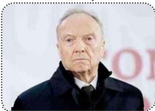
Alejandro Gertz Manero