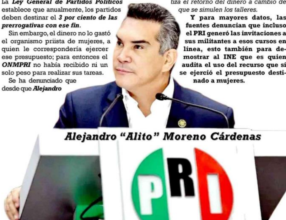
Alejandro “Alito” Moreno Cárdenas

Y para mayores datos, las fuentes denuncian que incluso el PRI generó las invitaciones a sus militantes a esos cursos en línea , esto también para demostrar al INE que es quien audita el uso del recurso que si se ejerció el presupuesto destinado a mujeres.