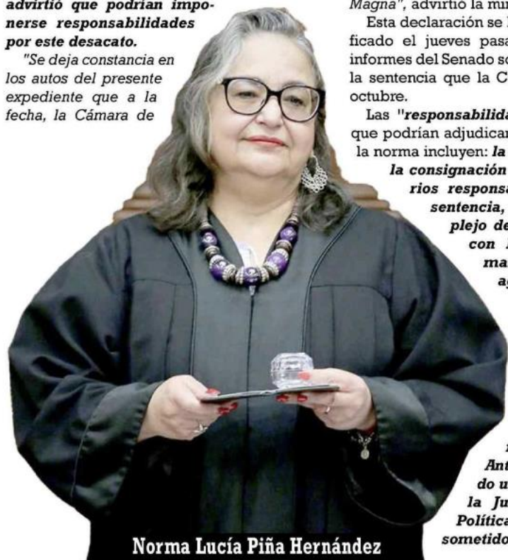
Norma Lucía Piña Hernández

"Se deja constancia en los autos del presente expediente que a la fecha, la Cámara de