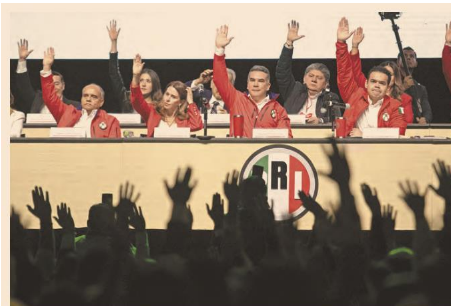
Durante la Asamblea de ayer en el PRI se registraron confrontaciones entre militantes debido a las reformas avaladas al interior del partido.