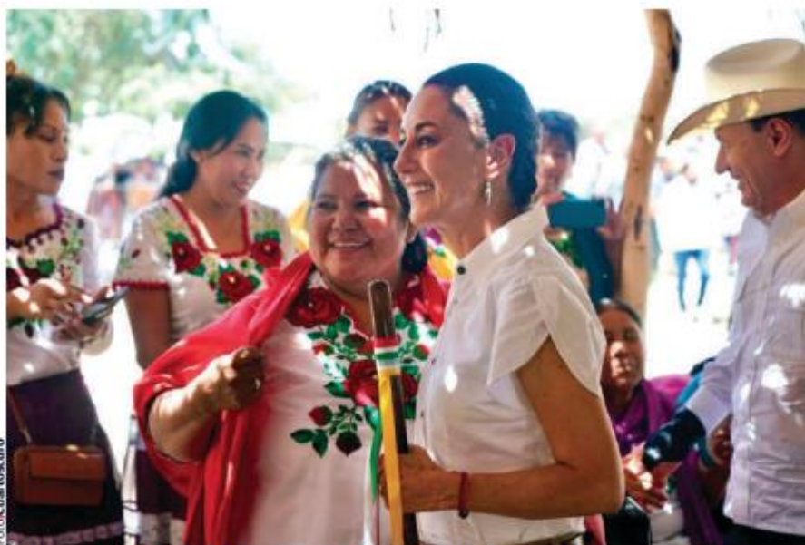
CLAUDIA SHEINBAUM, virtual Presidenta electa, ayer en Guaymas, Sonora.

LA VIRTUAL PRESIDENTA electa se compromete a seguir con la reforma constitucional en beneficio de comunidades indígenas; AMLO señala que se mantendrán los programas sociales