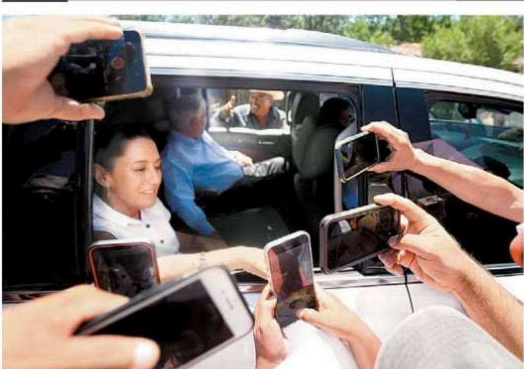
El Presidente y la virtual mandataria electa saludan a habitantes de Guaymas. ARIANA PÉREZ