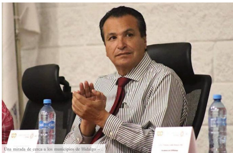
Una mirada de cerca a los municipios de Hidalgo – .