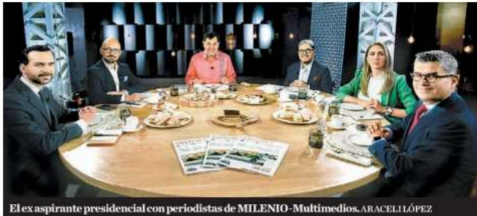
El ex aspirante presidencial con periodistas de MILENIO-Multimedios. ARACELI LÓPEZ

Al principio era acartonada, ahora conecta con la gente. —