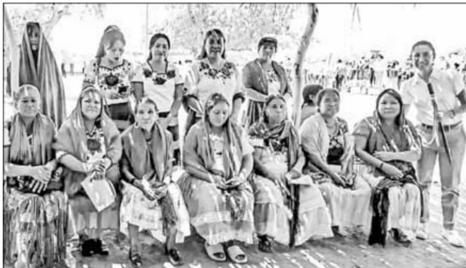
▲ En Vicam Pueblo, Sonora, Claudia Sheinbaum concluyó su cuarta gira conjunta con López Obrador.

Así cerró la cuarta gira de trabajo conjunta por el país.