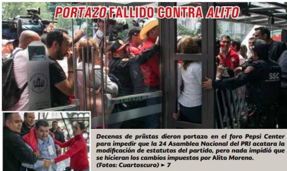
Decenas de priistas dieron portazo en el foro Pepsi Center para impedir que la 24 Asamblea Nacional del PRI acatara la modificación de estatutos del partido, pero nada impidió que se hicieran los cambios impuestos por Alito Moreno. ▶ 7