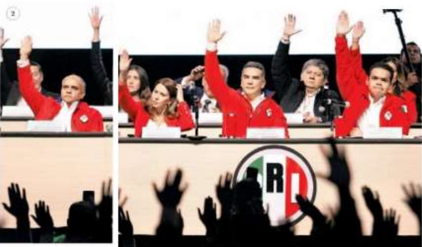
1 Portazo en el Pepsi Center por parte de militantes del tricolor. J. RÍOS