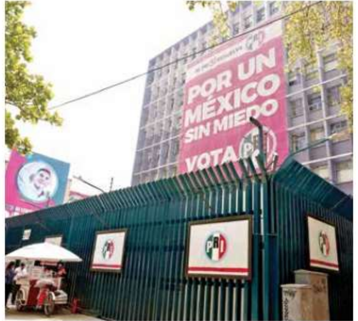
En su existencia, no ha habido reelección de dirigente.