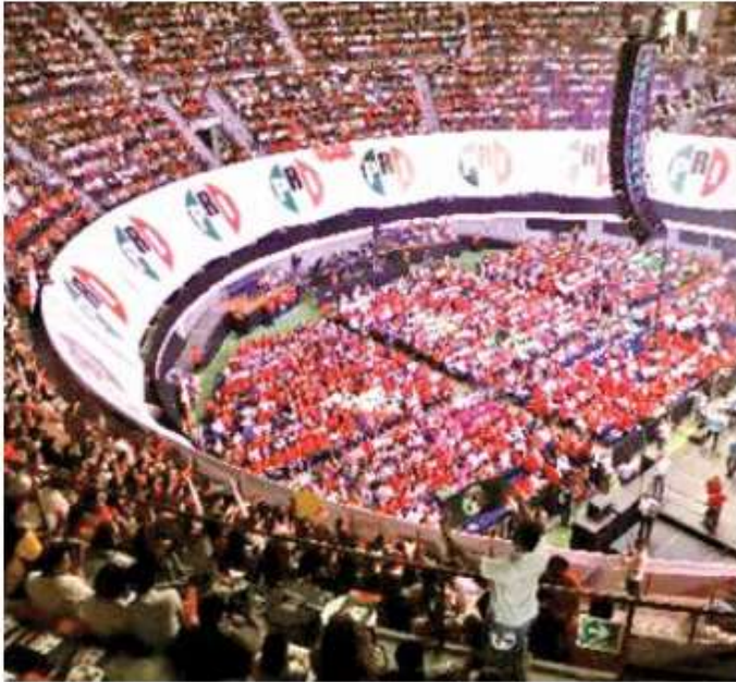
Delegados priistas apoyan por mayoría al dirigente nacional.