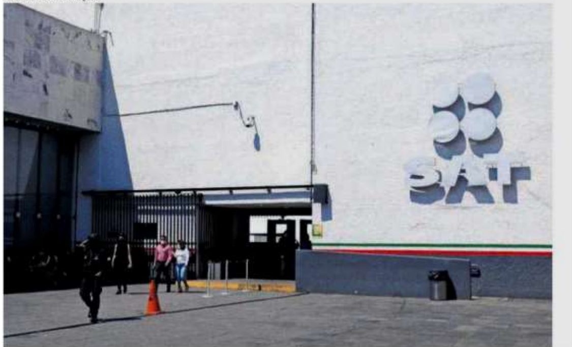
Durante el actual gobierno se han demandado a funcionarios que trabajan en el SAT