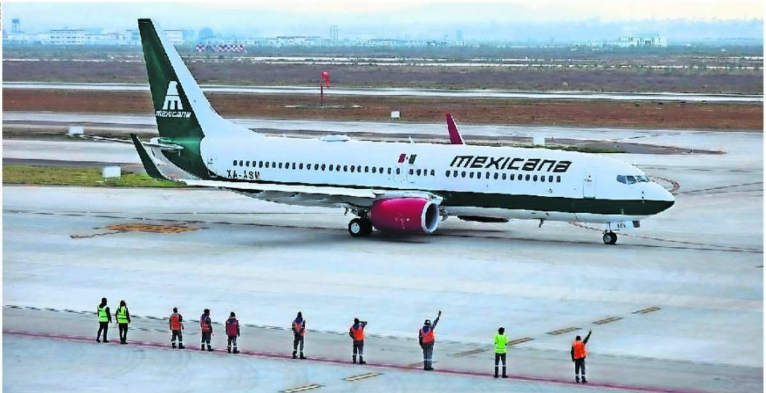
La Aerolínea del Estado Mexicano, Mexicana de Aviación, no alcanza a despegar y su operación es deficitaria y muy onerosa para toda la población, denuncian legisladores.