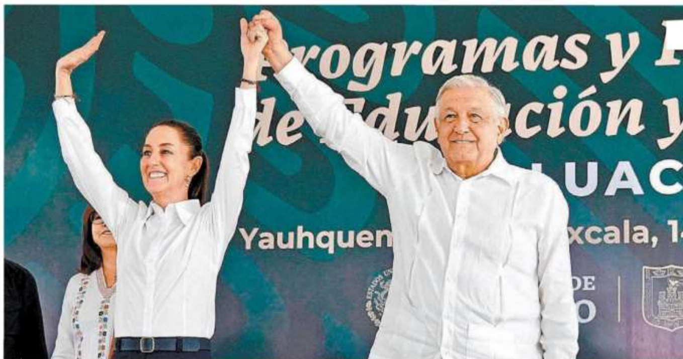
La exjefa de Gobierno junto a López Obrador en su gira de fin de semana por Tlaxcala.