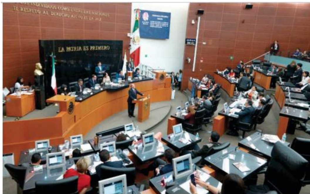
SESIÓN de la Comisión Permanente en el Senado de la República, en imagen de archivo.