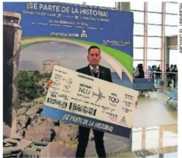
Mexicana no transportó ni a 100 mil personas en cinco meses de 2024 y empresas competidoras han sumado en ese periodo entre 6 y 9 millones de pasajeros.