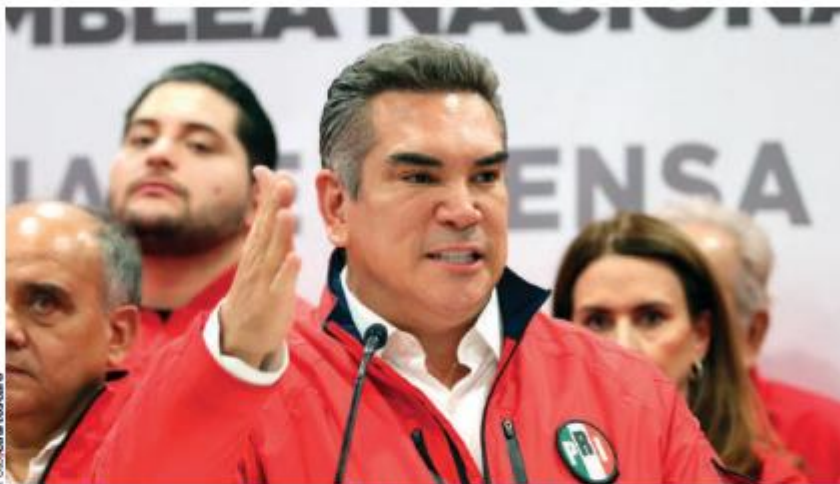
ALITO MORENO, dirigente nacional del PRI, el 8 de julio en conferencia de prensa.

COLDWELL, SAURI Y BELTRONES piden que el TEPJF suspenda el proceso iniciado en su partido; consideran inconstitucional que se pretenda realizar la renovación de la dirigencia