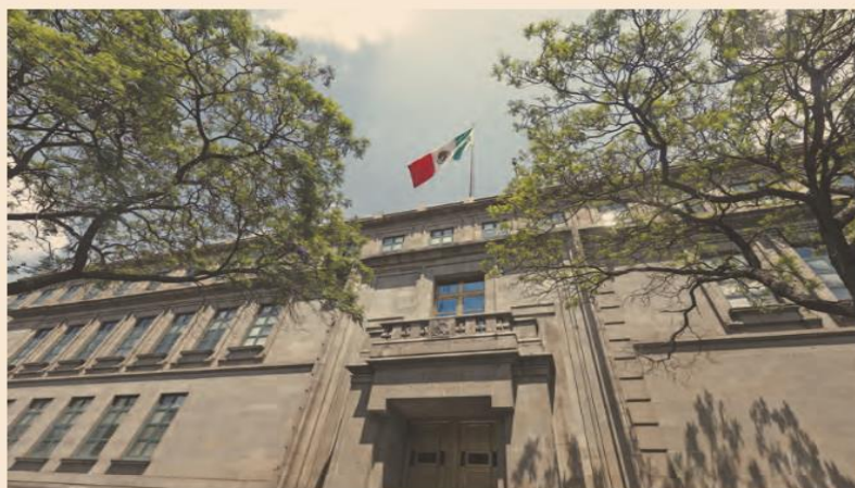
La presidenta del Poder Judicial, Norma Piña, ha asegurado que se defenderán los derechos de los trabajadores del Poder Judicial federal.

• Jueces han señalado que hay incertidumbre sobre los derechos laborales de los trabajadores