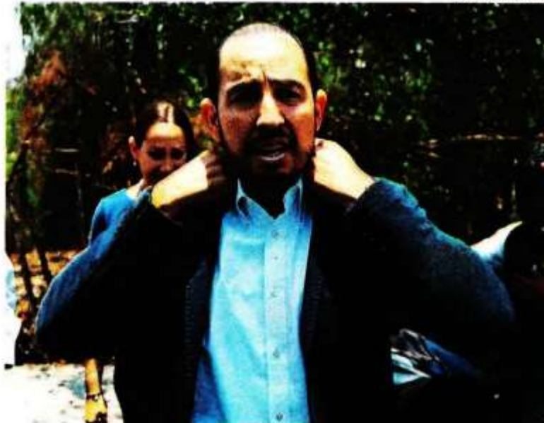
El PAN cocina su su propio proyecto a la reforma.