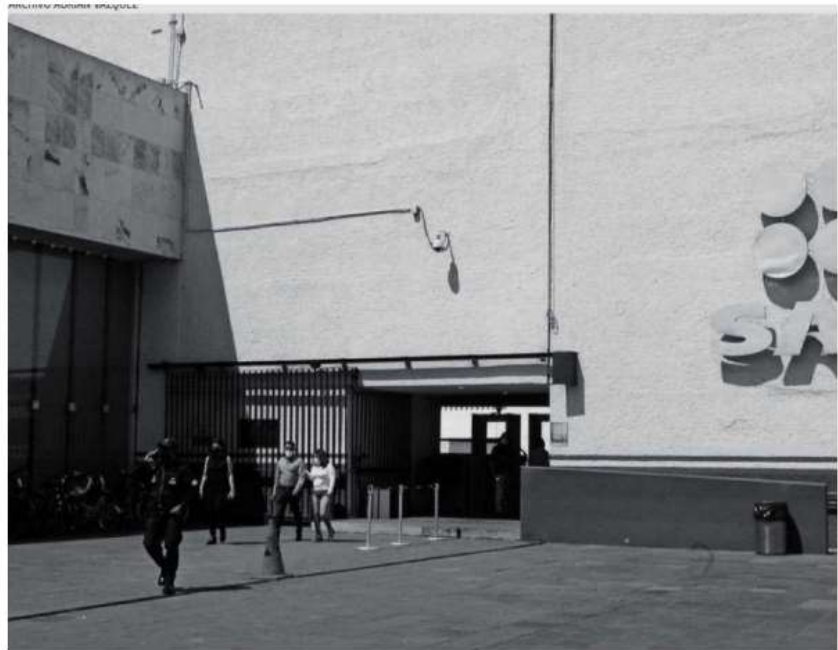
Durante el actual gobierno se han demandado a funcionarios que trabajan en el SAT

TRABAJADORES tienen cargos como directores de área, subdirectores o jefes de unidad