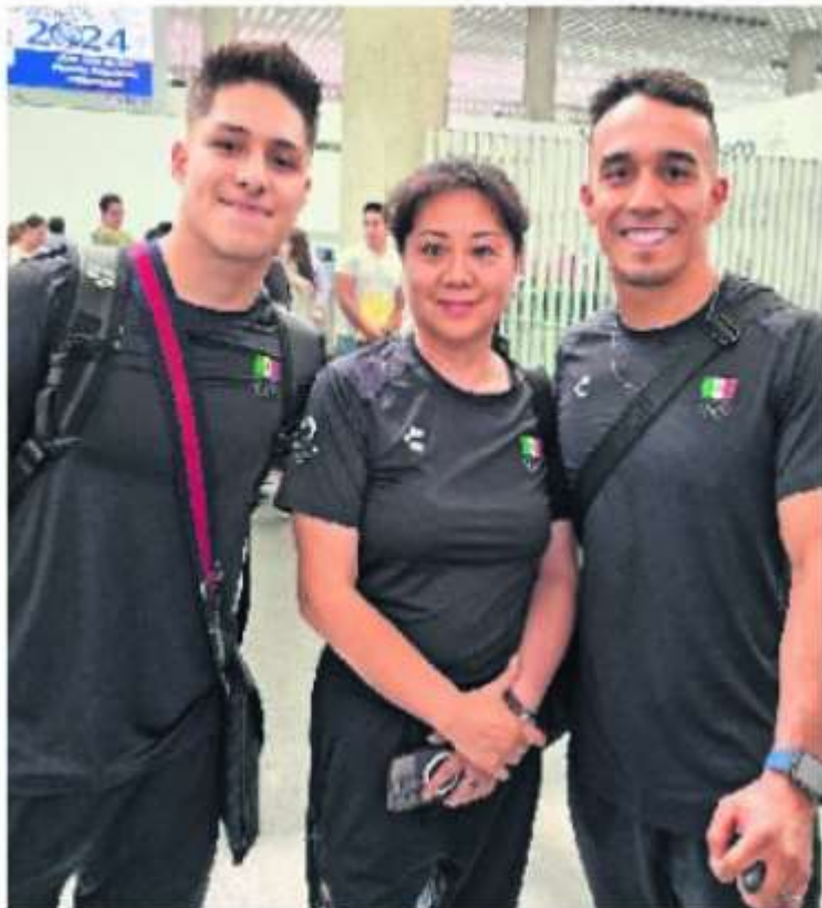
Los atletas viajaron con mucha confianza a París.