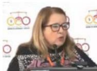
Postura. La ministra de la Suprema Corte Loretta Ortiz Ahlf.

“No es una falta de los jueces o del Poder Judicial si no está bien integrada la carpeta de investigación;