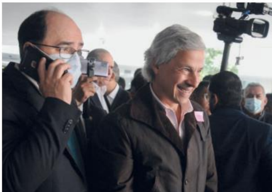
Claudio X. González impulsa una nueva manifestación contra la 4T.

En sus redes sociales, el multimillonario heredero del grupo Kimberly Clark posteó un cartel en el que el Frente Cívico Nacional (FCN) —que lidera el perredista Guadalupe Acosta Naranjo y Emilio Álvarez Icaza— llama a movilizarse previo a que el Instituto Nacional Electoral (INE) defina de manera oficial la distribución de los espacios plurinominales en el Congreso que le darían la mayoría calificada a Morena y sus aliados en la Cámara de Diputados y se quedaría a solamente dos escaños en la Cámara de