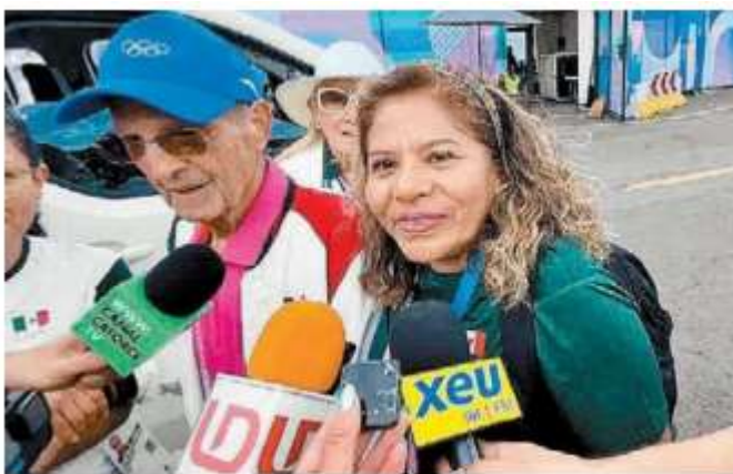
La dirigente del COM fue a felicitar a las arqueras. ESPECIAL