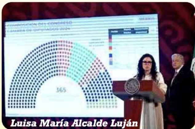
Luisa María Alcalde Luján