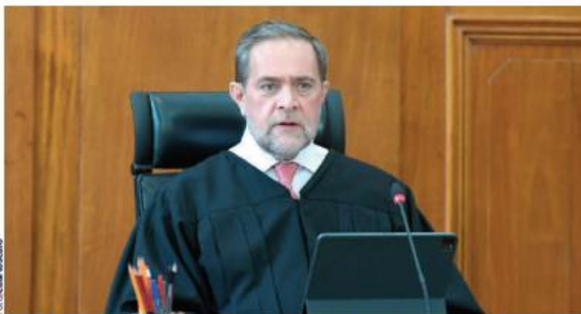
EL MINISTRO DE LA SCJN Jorge Mario Pardo Rebolledo, en imagen de archivo.

EL MINISTRO DE LA SCJN se pronuncia en favor de integrar a la Corte con personas con carrera judicial; reconoce la necesidad de informar a la sociedad que hay juzgadores preparados