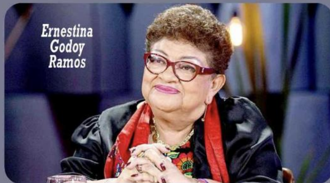
Ernestina Godoy Ramos