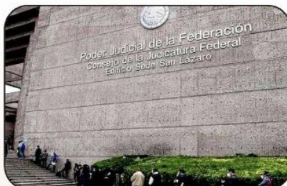
Poder Judicial de la Federación