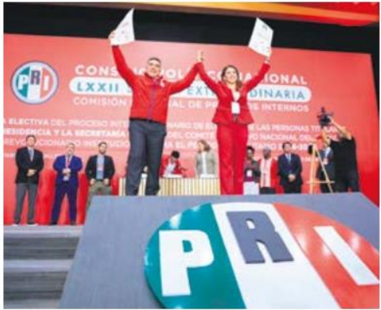
Elección. Imagen de Alejandro Moreno, líder nacional del PRI.