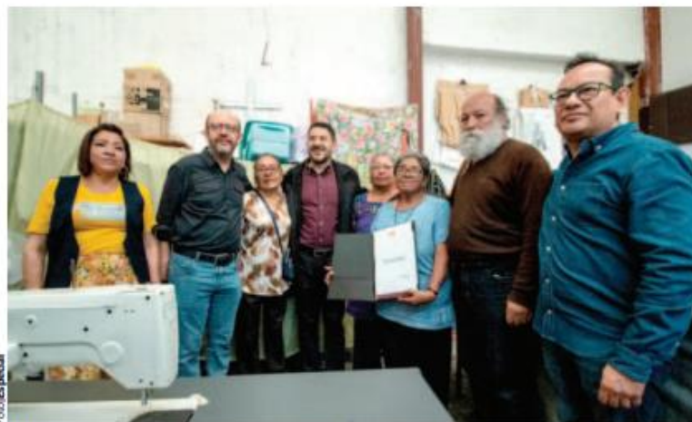
MARTÍ Batres (centro) durante la entrega de un predio a mujeres trabajadoras, ayer.

EL JEFE DE GOBIERNO , Martí Batres, señala que partidos usaron esta forma de gobernar para perjudicar a ciudadanía; crítica a la Marea Rosa; entrega predio para educación de mujeres