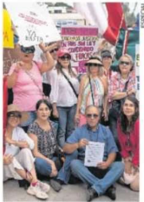
Piden respeto al principio de representación en el Congreso.