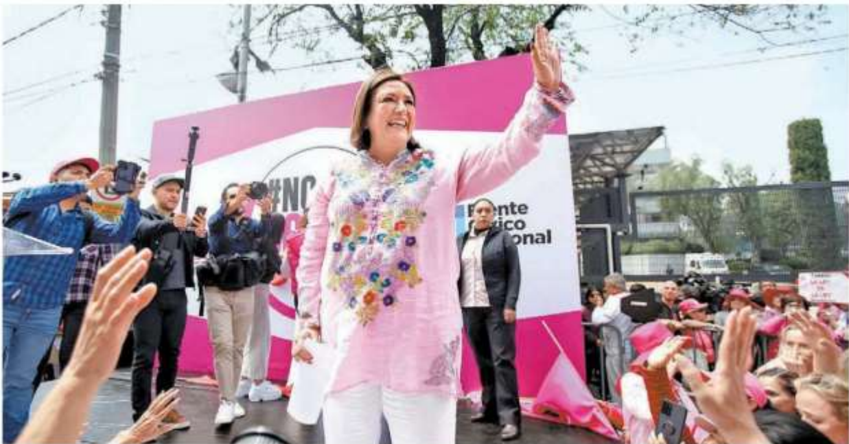
La ex candidata presidencial Xóchitl Gálvez durante la manifestación. ARIANA PÉREZ