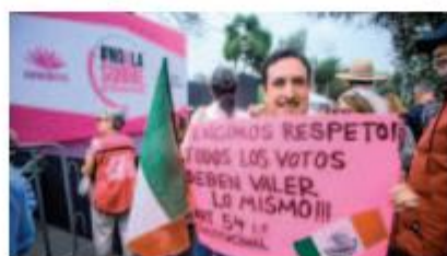
UN INTEGRANTE del colectivo sostiene un cartel durante la manifestación, ayer.