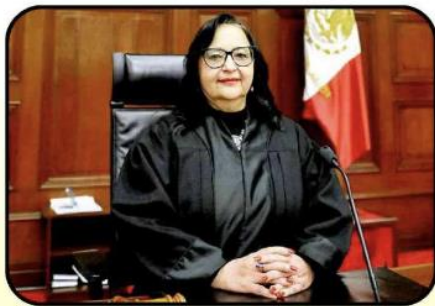
Norma Lucía Piña Hernández