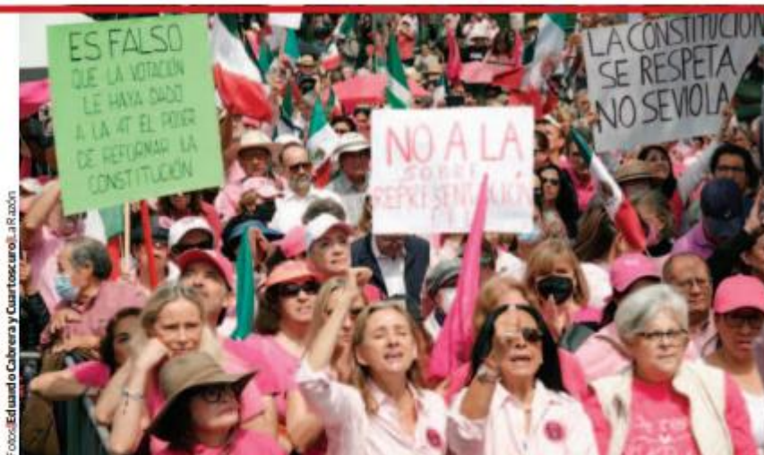
AYER, simpatizantes de la Marea Rosa protestaron en las inmediaciones del INE.