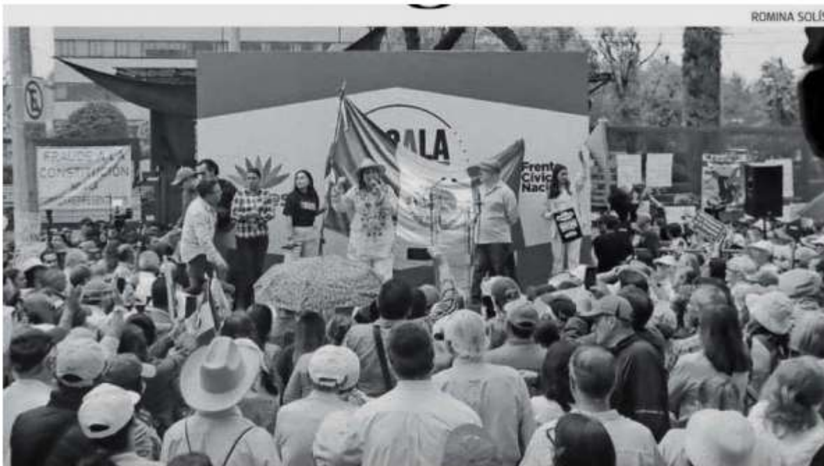
La Marea Rosa se manifestó ayer afuera del Instituto Nacional Electoral

SUBRAYAN QUE de avanzar ese agandalle darán la pelea jurídica y además señaló que los consejeros electorales tienen tiempo para revisar la Constitución.