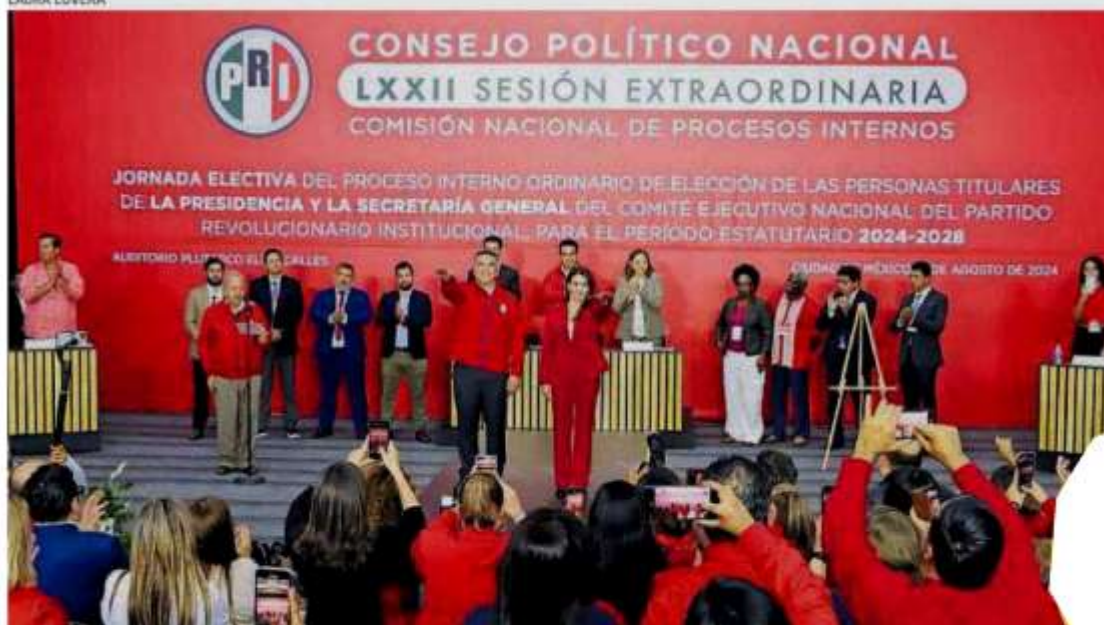
Alejandro Moreno y Carolina Viggiano rinden protesta como nuevos dirigentes del PRI