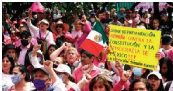
PROTESTA, ayer, en contra de la sobrerrepresentación de Morena.

CUESTIONA frente al INE pretensión "salvaje e inconstitucional" de Morena y aliados; Xóchitl acusa intención de robar 10 millones de votos y pide mucho más presión. págs. 7 y 8