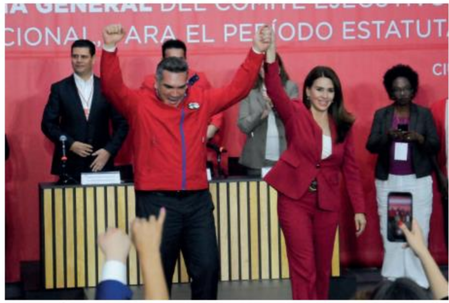
Su reelección fue aprobada por el 97% de los sufragios emitidos.

"Lo que hay que atender es no atender contra la unidad de nuestro partido, no pretender dividir al partido y al final del camino si me preguntan si hay solicitudes de proceso para la expulsión de quienes han manifestado una campaña de mentiras, de calumnias y difamación, sí, las han presentado ante los órganos del partido", dijo el priista tras concluir el proceso. •