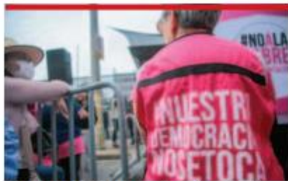
MIEMBROS de la movilización portaban ropa distintiva del movimiento.