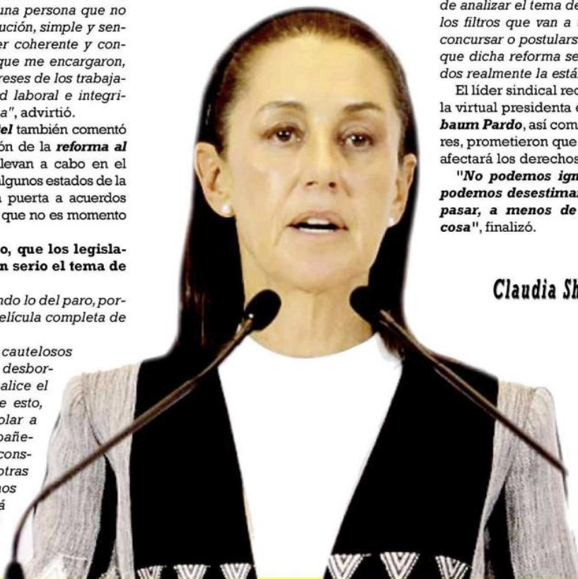
Claudia Sheinbaum Pardo

"No podemos ignorar esto y tampoco podemos desestimar que la reforma va a pasar, a menos de que se decida otra cosa", finalizó.