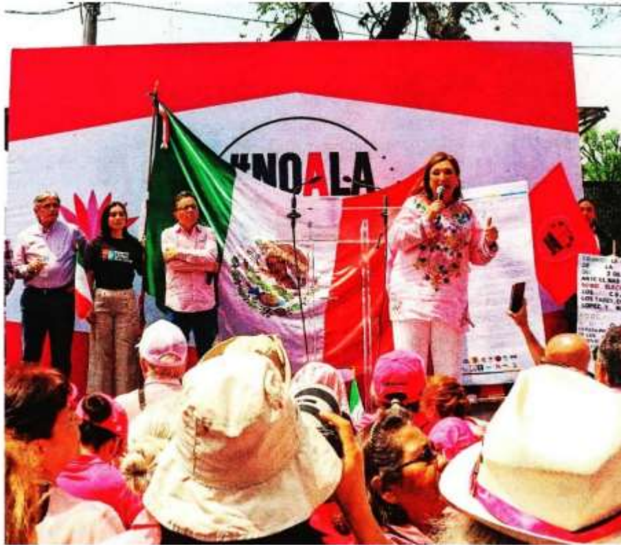
Xóchitl Gálvez , aseguró que Morena y sus aliados se quiere "robar" 10 millones de votos.