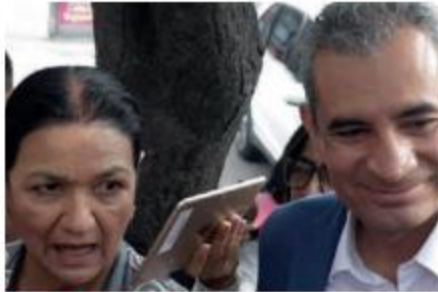
Sauri, Coldwell y Ochoa Reza denunciaron la reelección.

La reelección de Moreno, según los exdirigentes, es un acto de "secuestro" del partido por intereses personales. Critican que esta decisión fue tomada a "puerta cerrada, sin propuestas, ni debate, ni