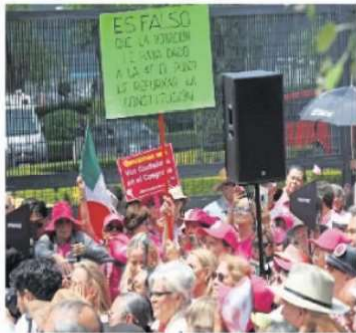
Manifestantes llegan con pancartas y lonas para exigir al INE actué conforme a la Constitución.

— “No, dile a tus compañeros que no se les va a afectar... es más, van a tener oportunidad de ser jueces por medio de la elección”, esgrimió. ●