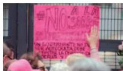
PERSONAS colocan cartulinas tras la marcha contra la sobrerrepresentación.

“SISE otorga la salvaje e inconstitucional sobrerrepresentación al oficialismo en la Cámara de Diputados, se le permitiría a éste modificar la Constitución, ignorando al 46% de los electores que no votaron por ellos”