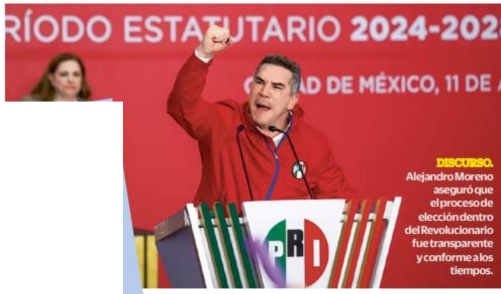
DISCURSO. Alejandro Moreno aseguró que el proceso de elección dentro del Revolucionario fue transparente y conforme a los tiempos.

ALEJANDRO MORENO Dirigente Nacional del PRI