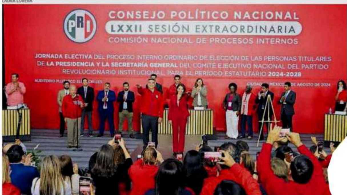
Alejandro Moreno y Carolina Viggiano rinden protesta como nuevos dirigentes del PRI