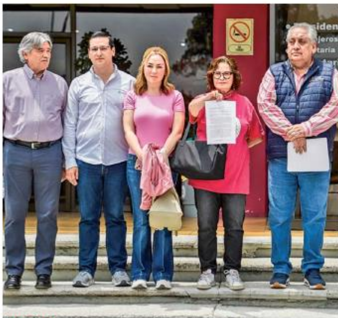
SOLICITUD. La Marea Rosa entregó un documento al INE en contra de la sobrerrepresentación firmado por diversas organizaciones sociales.