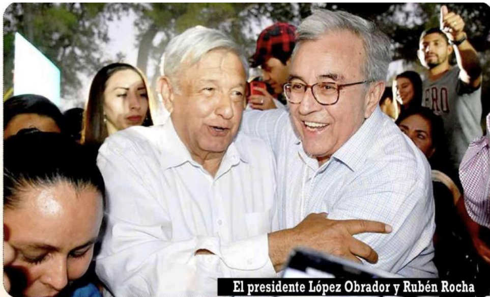
El presidente López Obrador y Rubén Rocha