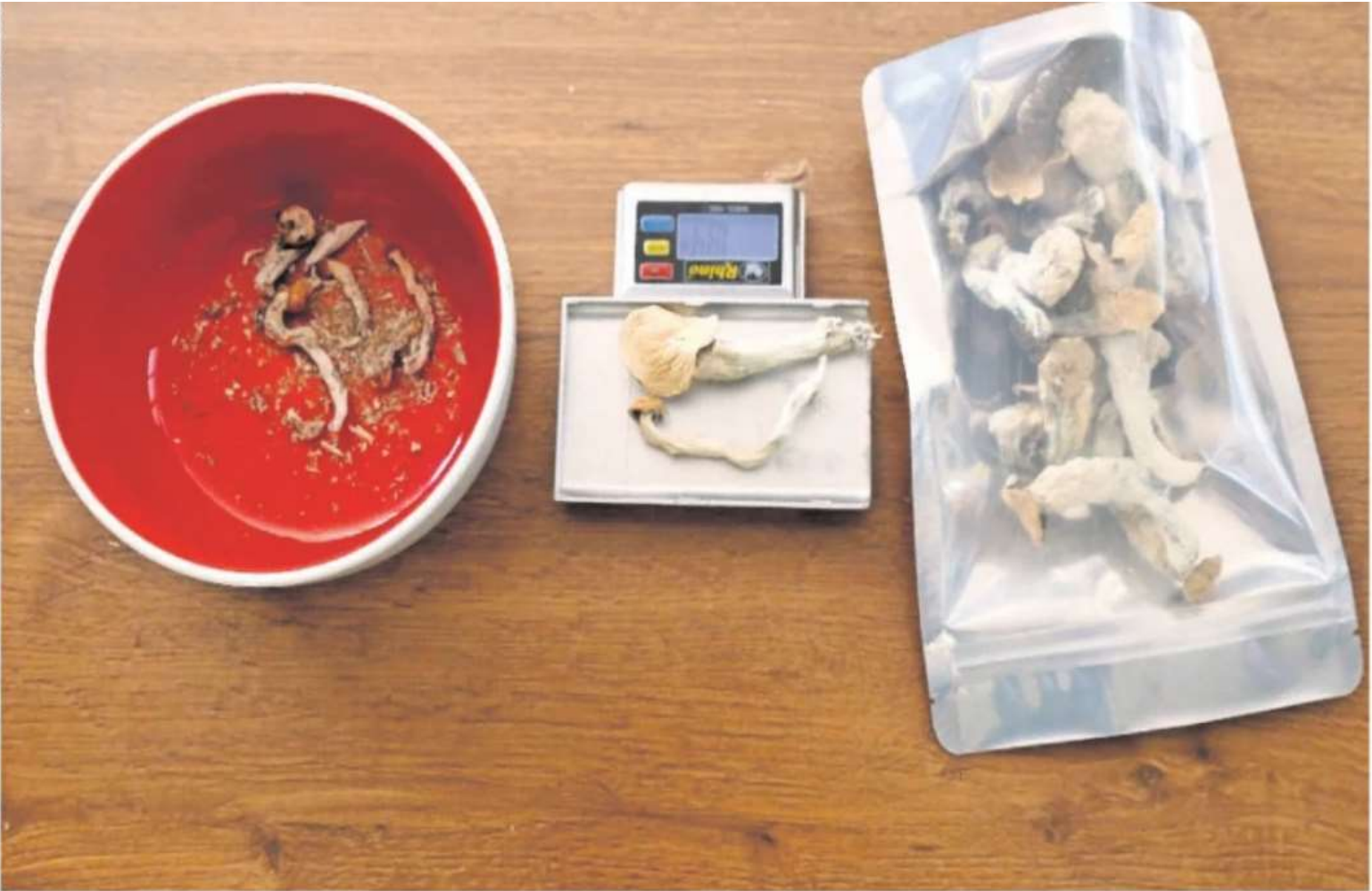
La excepción de la prohibición, especificada en el Código Penal, es para las comunidades indígenas que realizan rituales con los hongos medicinales.