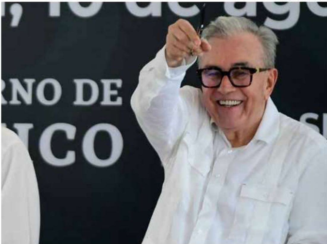
• CONFIANZA. El sábado el gobernador de Sinaloa recibió el respaldo del Presidente.