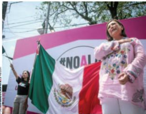
LA EXCANDIDATA presidencial de oposición durante la manifestación, ayer, frente a las instalaciones del INE.

"Ese es el debate jurídico que hemos dado. Ya lo dimos en el INE y si insiste el INE, lo vamos a dar en el tribunal y, si no, en las calles. Me preocupa el INE, la presión que ejerce la Presidencia de la República, intimidación, y también las ofertas. No nos extraña ver nuevos embajadores", dijo.