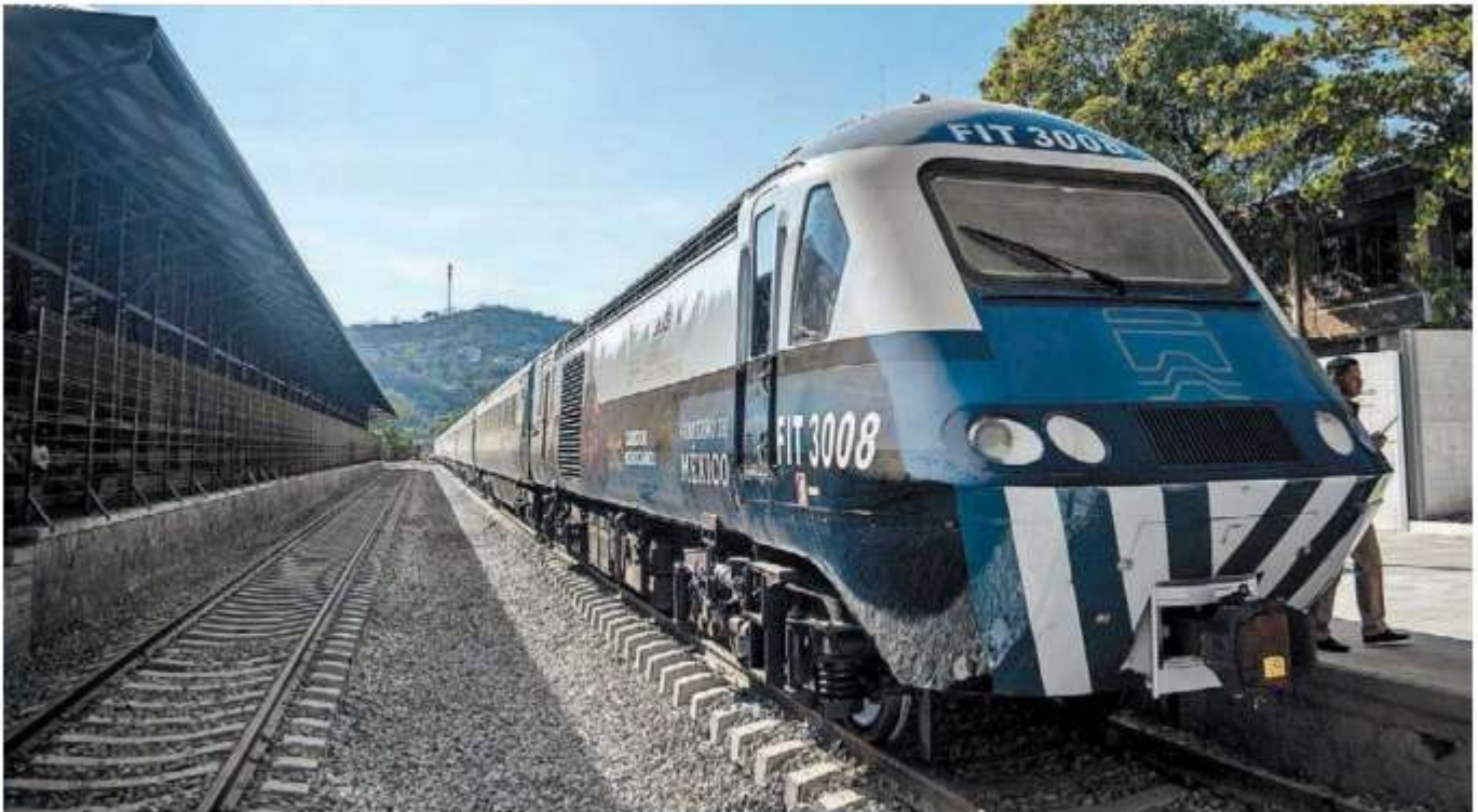
El Estado busca reformas a la Constitución para impulsar este transporte.