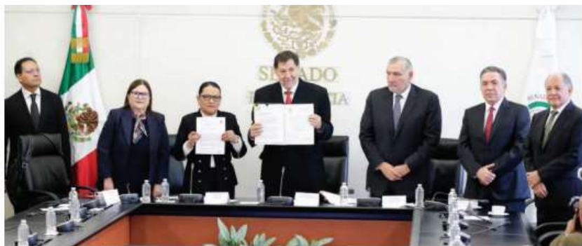
GERARDO FERNÁNDEZ Noroña (c.), flanqueado por Rosa Icela Rodríguez y Adán Augusto López, ayer.

"No caigamos en el error de jugar a las vencidas. Que cada quien haga lo que le corresponde hacer, seamos sensatos, pensemos en el país y no perdamos de vista el objetivo que haya justicia justamente en México. Ese es el objetivo y, por supuesto, el llamado es a que dejemos de jugar a las vencidas con los relojes legislativos", finalizó.