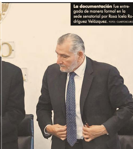
La documentación fue entregada de manera formal en la sede senatorial por Rosa Icela Rodríguez Velázquez.