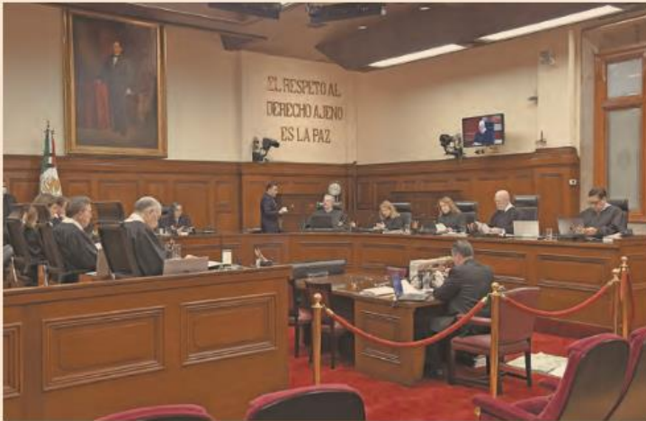
Los ministros debatieron sobre las atribuciones del artículo 11 de la Ley Orgánica del Poder Judicial de la Federación.

● El asunto fue turnado a un ministro de la mayoría, de entre los ocho que votaron en contra, para elaborar la propuesta