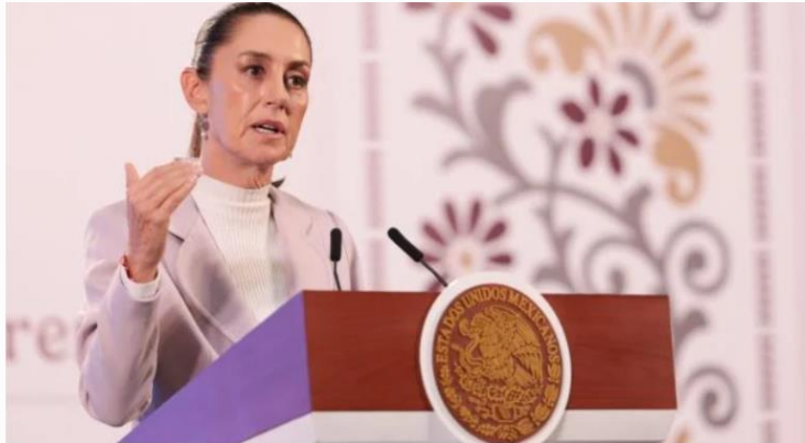
Claudia Sheinbaum

Sheinbaum envió dos iniciativas para la Ley General de Instituciones Procedimientos Electorales y la Ley General del Sistema Medios de Impugnación en Materia Electoral para las elecciones de jueces.