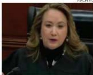
La ministra Yasmín Esquivel Mossa en imagen del pasado jueves.

La ministra Yasmín Esquivel Mossa precisó en sus propuestas que si bien son procedentes las consultas formuladas para que el Tribunal Pleno determine cuál es el trámite que habrá de dictarse, “lo solicitado resulta notoriamente improcedente y debe desecharse”, contrario al proyecto del Ministro González Alcántara presentado la sema-