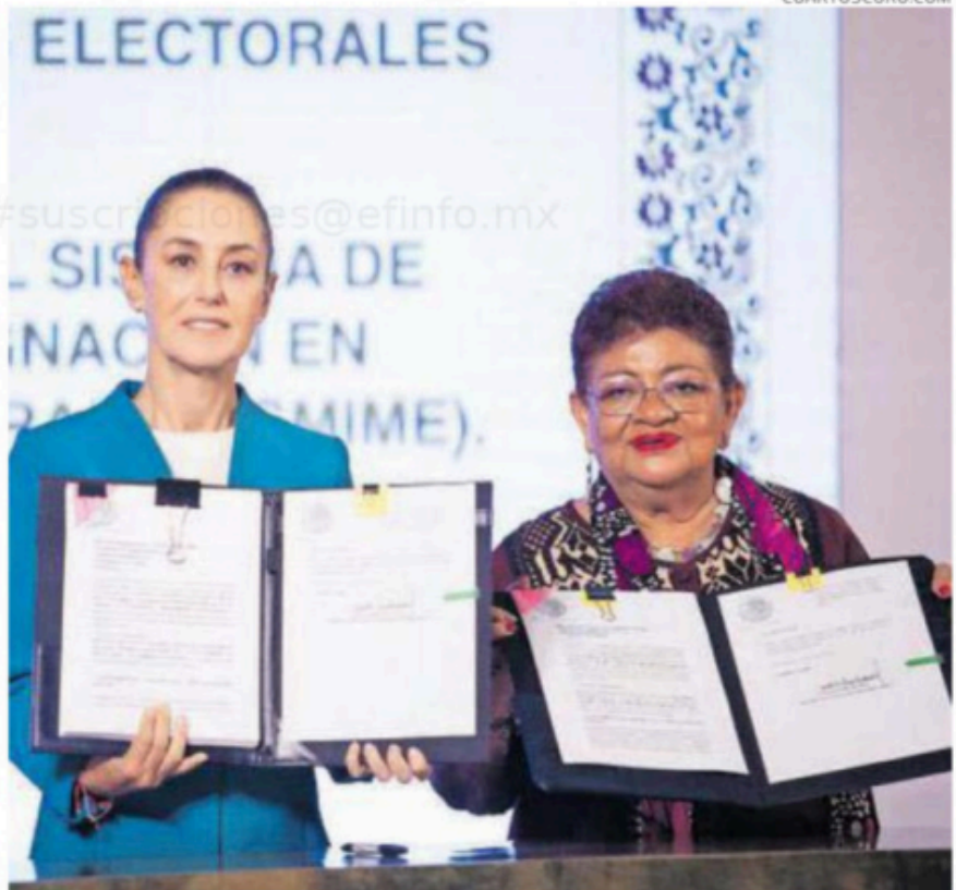
Claudia Sheinbaum y Ernestina Godoy durante la firma de documentos que llevaron a la cámara de Senadores.