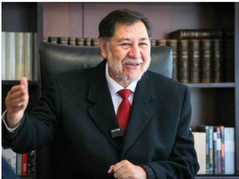
GERARDO FERNÁNDEZ NOROÑA

NO HAY REFORMA al Poder Judicial, hay un marco constitucional. Hoy es constitucional, y que la Corte diga que va a revisar la constitucionalidad de la Constitución es ridículo. No tienen atribuciones, ya es ley vigente, pero no cualquier ley, es la Constitución"