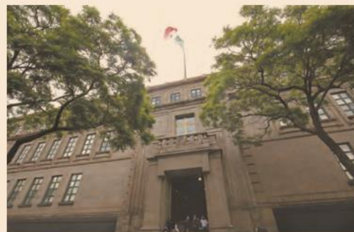
La controversia puede promoverla el Legislativo, Ejecutivo y Judicial de los estados.

Y establece: “En las controversias previstas en esta fracción únicamente podrán hacerse valer violaciones a esta Constitución, así como a los derechos humanos reconocidos en los tratados internacionales de los que el Estado mexicano sea parte”.