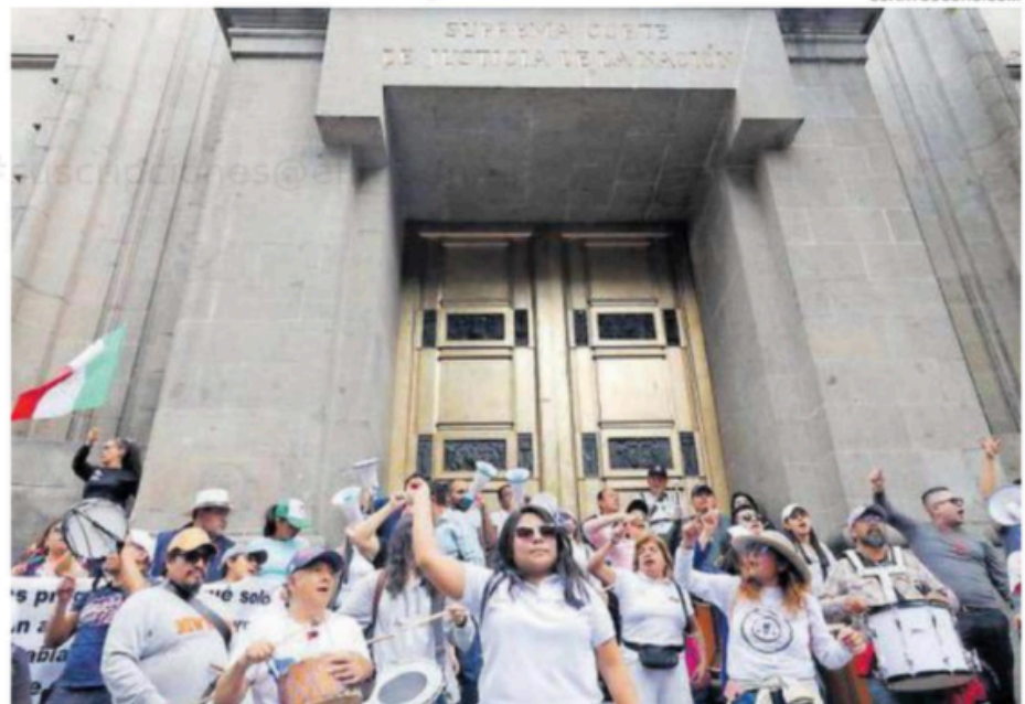
Trabajadores del Poder Judicial insisten en frenar la reforma.

Así, rechazaron el pleno de la Suprema Corte determinó no avalar los proyectos de las ministras Yasmín Esquivel