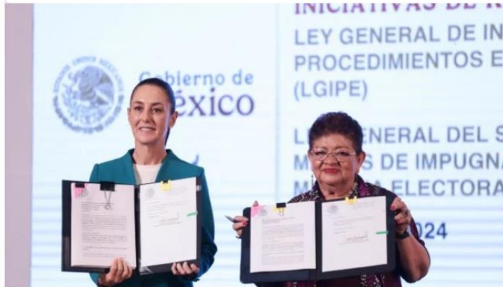
Claudia Sheinbaum

La secretaria de Gobernación, Rosa Icela Rodríguez Velázquez, entregó al senador Fernández Noroña los dos proyectos para modificar las leyes generales de Instituciones y Procedimientos Electorales, y del Sistema de Medios de Impugnación en Materia Electoral.