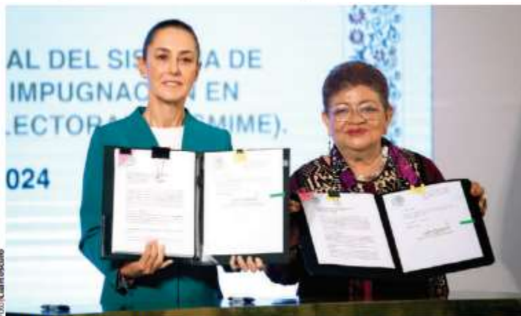
CLAUDIA SHEINBAUM PARDO y Ernestina Godoy, ayer en conferencia matutina.

Sobre el costo general de la elección, explicó que aún no es posible establecer el monto, pues primero se deben conocer los detalles que implicarán gasto, como diseño y cantidad de boletas, lo cual está a cargo del INE.