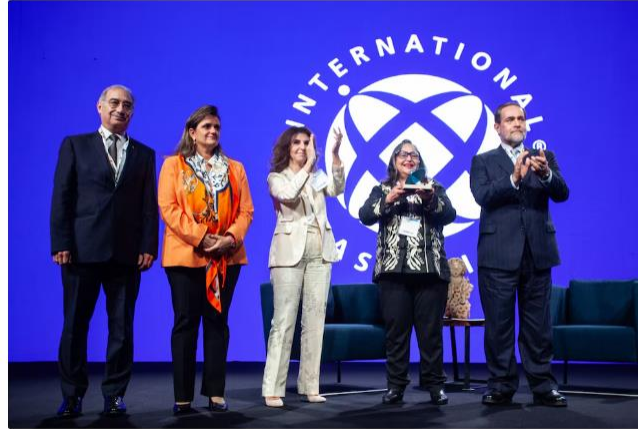
Algunos ministros de la Corte durante la inauguración de International Bar Association en el Centro de Convenciones Citibanamex.

La Suprema Corte de Justicia de la Nación (SCJN) confirmó este lunes 7 de octubre que seguirá la consulta sobre la reforma al Poder Judicial , pero aclaró que se trata de consultas para que el Pleno determine qué trámite debe darse a las solicitudes, pero sin prejuzgar sobre el fondo de los asuntos.