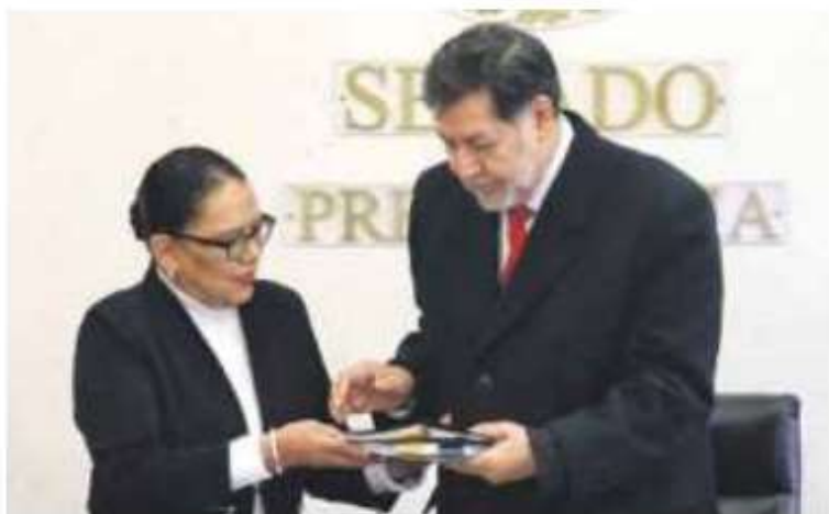
Sin demora. Entrega la Segob leyes secundarias de la reforma judicial.

El Senado prevé discutir las hoy en el pleno, asegura Fernández Noroña