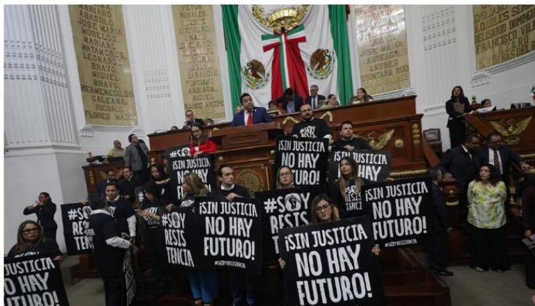
Protesta contra la reforma judicial en el Congreso mexicano.

La reforma judicial que aprobó el Poder Legislativo, promulgada por el expresidente mexicano Andrés Manuel López Obrador, sigue envuelta en una fuerte controversia debido a las 70 suspensiones emitidas por juzgados locales que pretenden frenar la inédita elección de jueces, magistrados y ministros de la Suprema Corte de Justicia de la Nación (SCJN), prevista para el próximo 1 de junio.