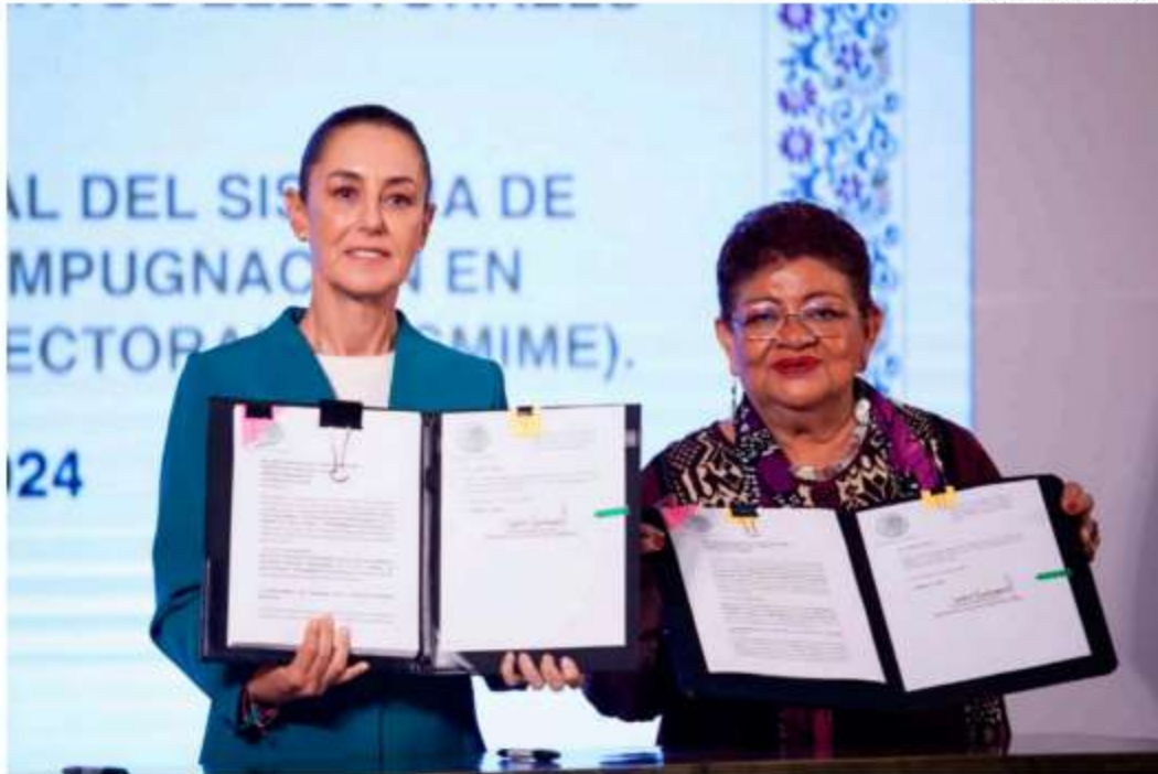
La presidenta muestra las dos reformas que firmó y que fueron enviadas al Senado.