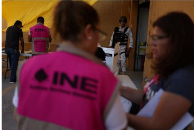
El INE busca recortar gastos lo más posible sin comprometer sus funciones regulares

Ante la publicación del Presupuesto de Egresos 2025 en el Diario Oficial de la Federación, el Instituto Nacional Electoral (INE) comenzó a analizar qué proyectos dejará de hacer en un futuro, así como decidir en qué áreas se recortarán recursos para poder llevar a cabo la próxima Elección Judicial , en la que la ciudadanía podrá elegir jueces, magistrados y ministros el año entrante.