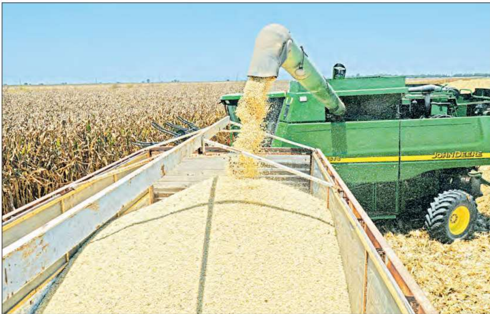
▲ Los productores de Sinaloa piden apoyo para la tecnificación del campo. En la imagen, cosecha de maíz en Culiacán.

“En 2015, se sumaron 150 hectáreas a la producción de frutillas, al remplazar los cultivos de maíz y sorgo... FIRA trabaja para que en 2018 se reconviertan 800 hectáreas al cultivo de berries ”, señala el documento de FIRA.