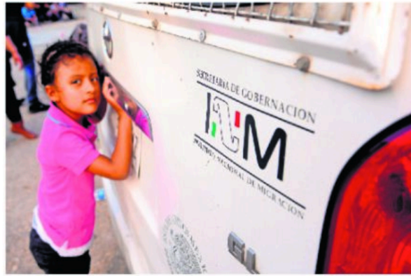
ÁNGEL HERNÁNDEZ. ARCHIVO CUARTOSURIO

Propone una reforma integral que garantice personal capacitado