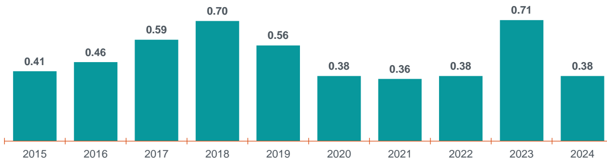
Gráfica 1 Variación del Índice Nacional de Precios al Consumidor diciembre de los años que se indican (variación porcentual mensual)