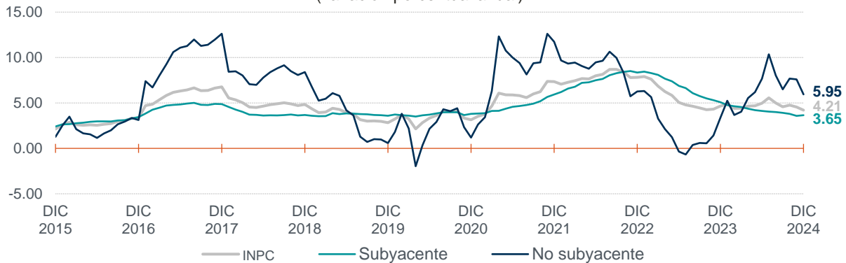
Gráfica 3 Variación del Índice Nacional de Precios al Consumidor (INPC) y sus componentes diciembre de 2015 a diciembre de 2024 (variación porcentual anual)